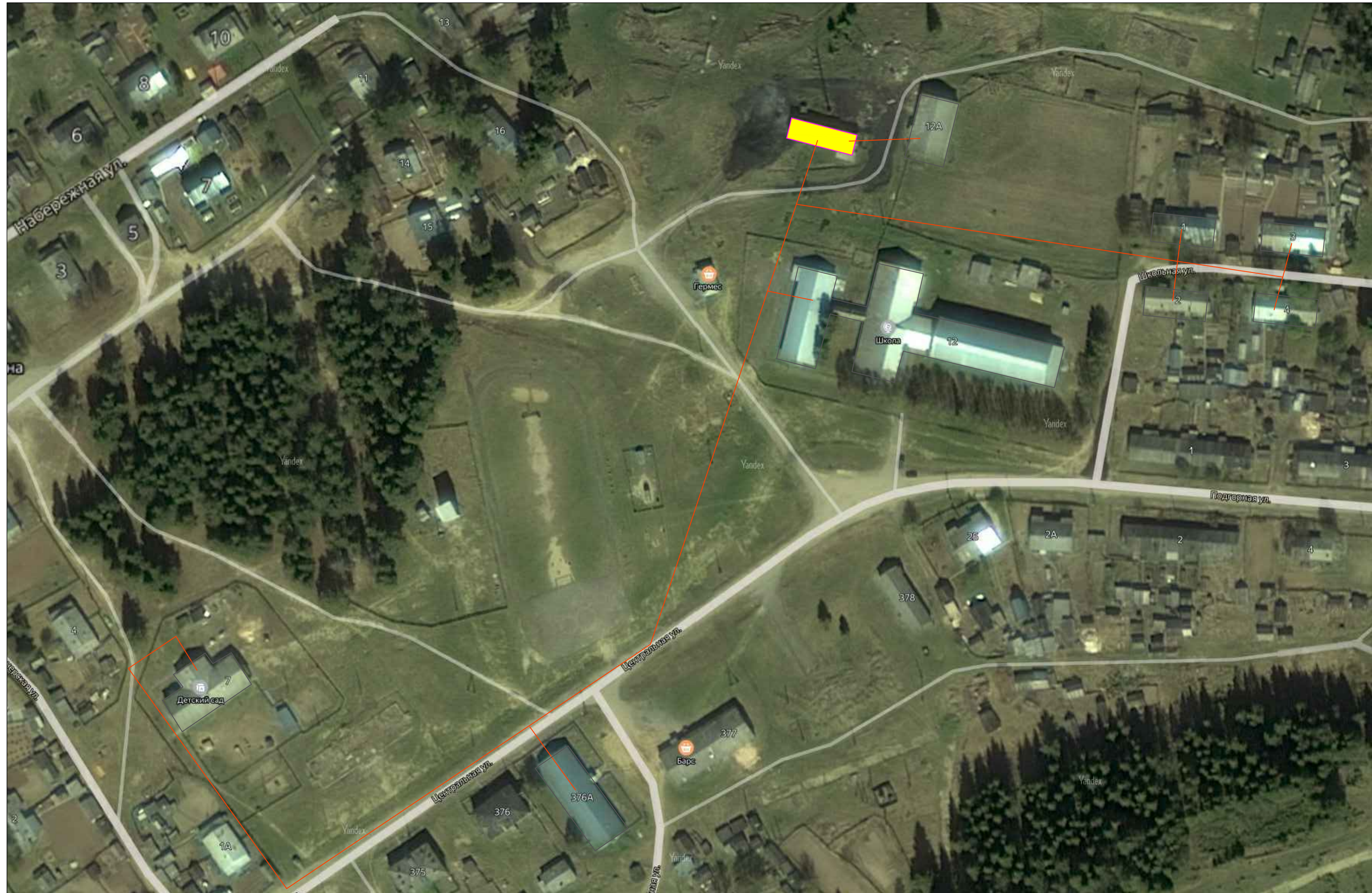
Границы сельского поселения